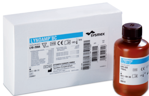
Reagenzien: LYNOAMP und LYNORHAG

Die intraoperative Beurteilung des Lymphknotengewebes erfolgt mittels histologischer Schnellschnittanalyse oder Imprintzytologie (die Zellen werden angefärbt und unter dem Mikroskop begutachtet). Diese Methoden haben jedoch eine eingeschränkte Sensitivität, da aus Zeitgründen nur ein geringer Teil des Lymphknotens analysiert werden kann. Da die Verfahrensweise zudem nicht standardisiert ist, werden speziell kleinere metastatische Herde erst während der weiterführenden und detaillierteren postoperativen Untersuchung am Paraffinschnitt entdeckt. Dies führt intraoperativ zu einer beträchtlichen Anzahl falsch negativer Ergebnisse (lt. Literatur zwischen 5–45% [2]) und einer entsprechenden Rate an Zweitoperative Ergebnis liegt erst nach einigen Tagen Wartezeit und Ungewissheit vor, und die Zweitoperation stellt eine erneute körperliche Beanspruchung dar.