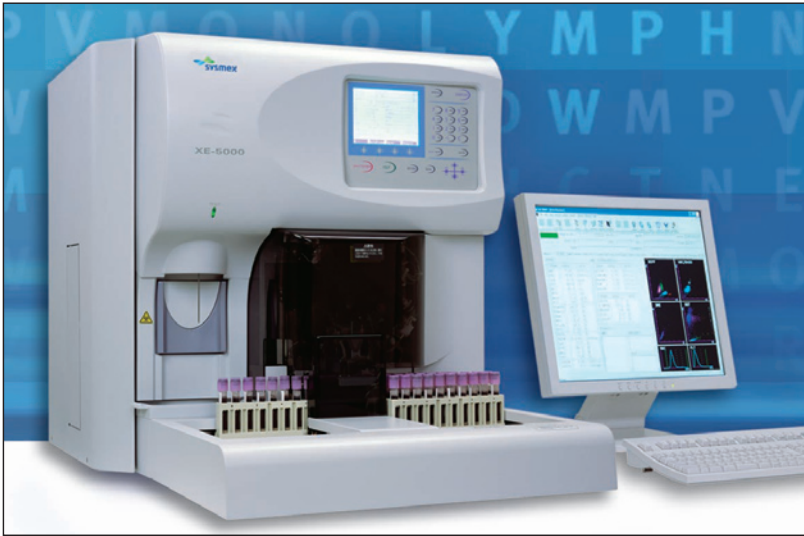
Abb. 1 Der SYSMEX XE-5000 Case Manager

SYSMEX' neues Top-Analysengerät für die Hämatologie, der XE-5000 Case Manager, verkörpert ein neues Konzept in der Diagnostik, indem es eine herausragende, analytische Messtechnologie (Fluoreszenz-Durchflusszytometrie) mit fallbezogenen, klinischen Informationen verknüpft.